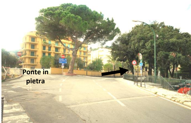
Punto 5 – Svolta a destra sulla via Calvisio

Procedere per 300 metri fino a raggiungere la chiesa di Finalpia (che ci si lascia sulla destra) e il torrente Sciusa, che qui è attraversato da un ponte in pietra percorribile solo in senso opposto.