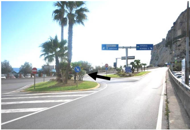
Punto 2 – Svolta a sinistra sulla via Aurelia

Arrivando con l'autostrada A10 (Genova-Ventimiglia), prendere l'uscita di Finale Ligure. Passato il casello, si procede per 800 metri fino ad immettersi sulla statale per Calizzano ( punto 1 ): qui girare a sinistra, in discesa (indicazione per Finale Ligure). Proseguire in discesa per 2,8 km, fino a raggiungere la via Aurelia, che in questo punto è quasi sul mare. Qui svoltare a sinistra sulla via Aurelia, seguendo l'indicazione per Finale Ligure ( punto 2 ).