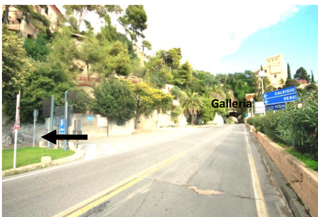
Punto 4 – Svolta a sinistra prima della galleria

Procedere per 400 metri, fino ad arrivare alla rotonda (piazza Vittorio Veneto; la stazione è sulla sinistra). Superare la rotonda, proseguendo sulla via Aurelia, lasciando il benzinaiolo alla propria destra ( punto 3 ).