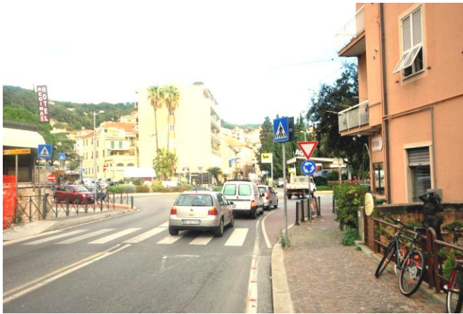
Punto 3 – Superare la rotonda

Arrivando con l'autostrada A10 (Genova-Ventimiglia), prendere l'uscita di Finale Ligure. Passato il casello, si procede per 800 metri fino ad immettersi sulla statale per Calizzano ( punto 1 ): qui girare a sinistra, in discesa (indicazione per Finale Ligure). Proseguire in discesa per 2,8 km, fino a raggiungere la via Aurelia, che in questo punto è quasi sul mare. Qui svoltare a sinistra sulla via Aurelia, seguendo l'indicazione per Finale Ligure ( punto 2 ).