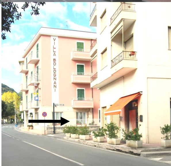
Punto 6 – Svolta a destra in via Bolognani

Costeggiare infine il torrente Sciusa per 300 metri, fino a trovare sulla propria destra la via Bolognani, in cui si dovrà svoltare ( punto 6 ).